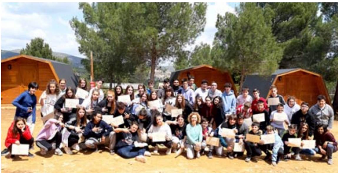
Los alumnos del Vega del Turia que participaron en el curso de inmersión lingüística posan en el campamento de Buñol