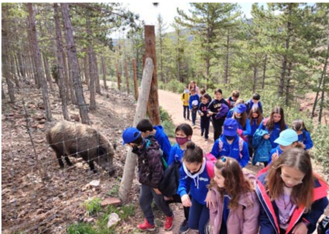
Estudiantes de Primaria de La Salle observan un jabalí durante su visita al parque faunístico La Maleza

Fue una experiencia de aprendizaje y convivencia muy gratificante para los alumnos y profesores que podrán recordar siempre y que les ayudará a comprender e interiorizar los conceptos trabajados en los seminarios de Ciencias Naturales del Nuevo Contexto de Aprendizaje por los que La Salle apuesta día a día.