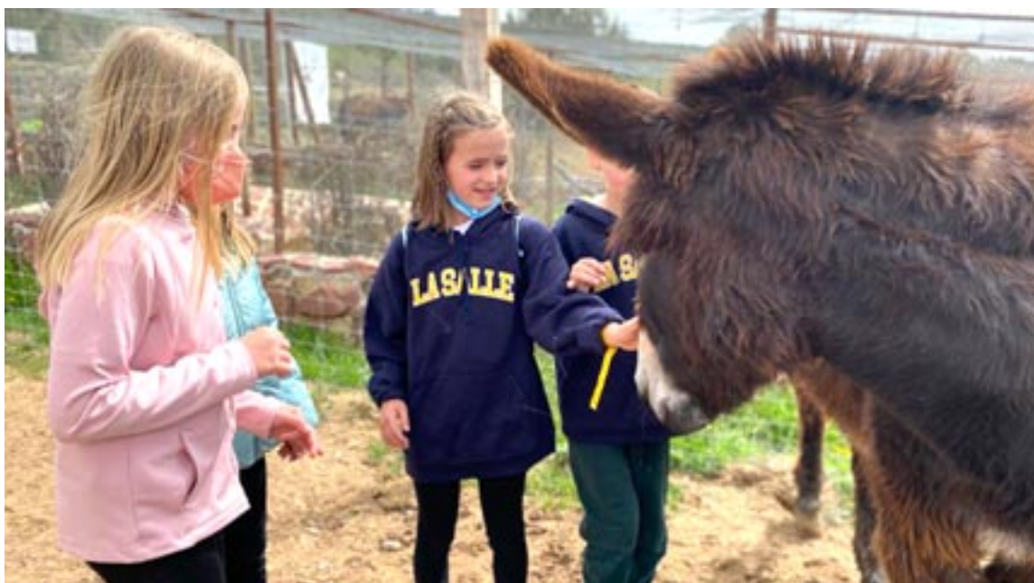
Una niña acaricia un burro, otro de los animales que muestra el parque junto con ovejas, cabras o gallinas