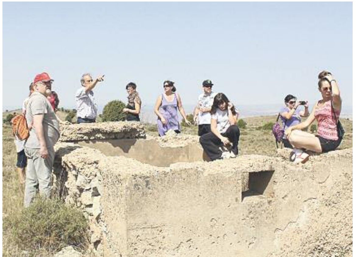
La Asociación de Vecinos de San Julián visitó ayer la Posición de Pancho Villa en el puerto Escandón