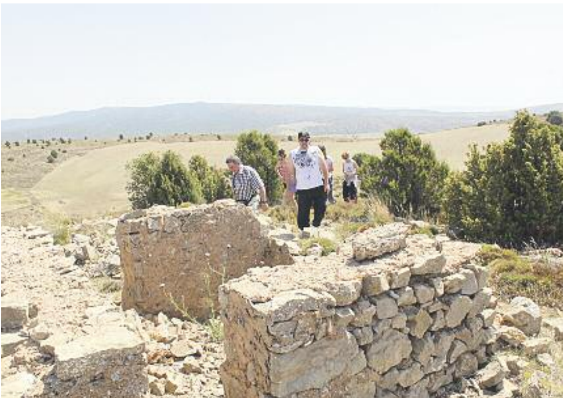
Parapetos de la Guerra Civil en la posición de Pancho Villa en el puerto Escandón.