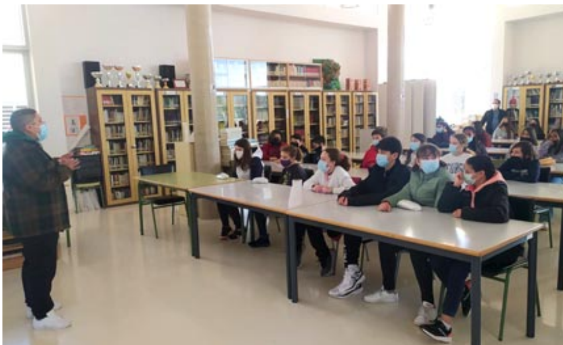
Charla sobre el colectivo trans en el IES Segundo de Chomón de Teruel

También destacaron la necesidad de que la formación llegue a los docentes que en ocasiones tienen miedo de esta realidad que no comprenden. En este caso se está realizando un curso en el Centro de Profesorado Ángel Briz.