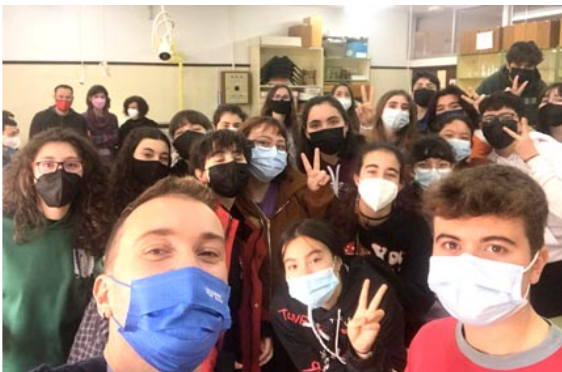
Estudiantes tras la actividad realizada por Chrysallis en el IES Francés de Aranda de Teruel