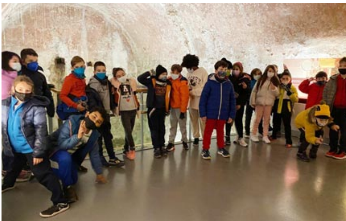
Los alumnos del CEIP Ensanche en los aljibes