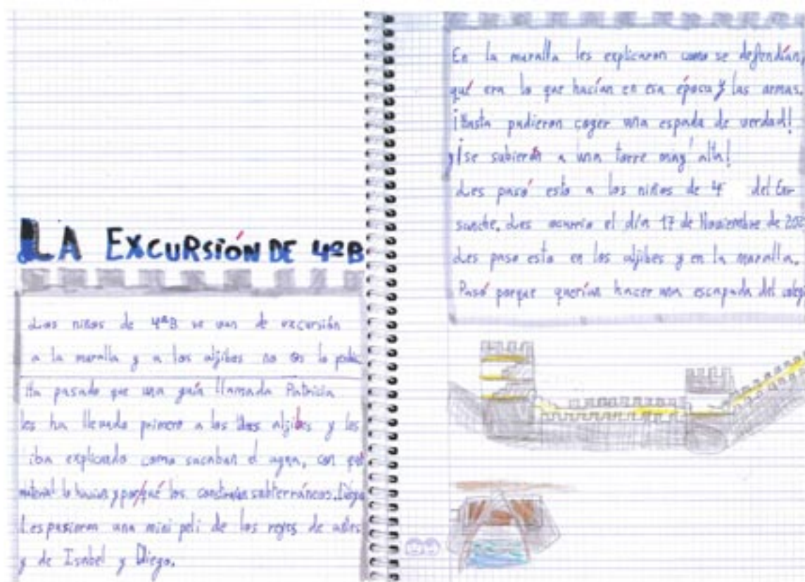
Manuscrito de la redacción de Gema Puntero sobre la visita a la muralla y los aljibes

Les pasó esto en los aljibes y en la muralla. Pasó porque querían hacer una escapada del colegio.