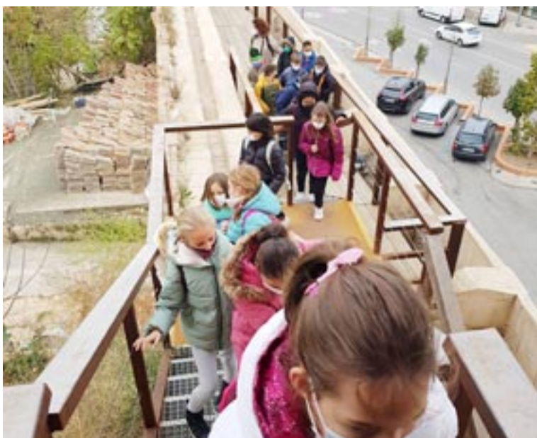
Los escolares de cuarto del colegio Ensanche durante su visita a la muralla